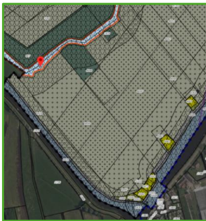
Enkelbestemming: Water -1