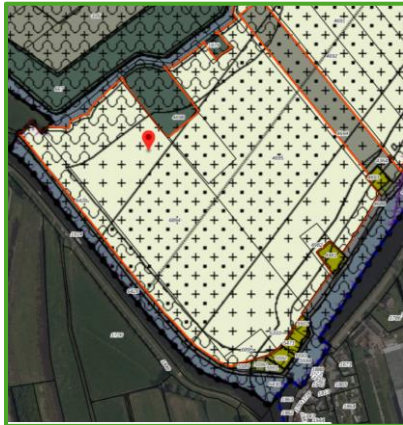
Enkelbestemming: Agrarisch - Veehouderij 1