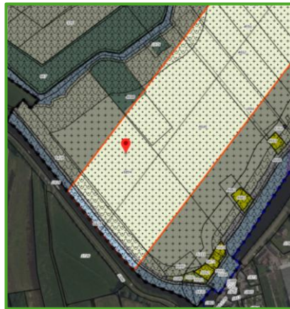
Dubbelbestemming: leiding - Hoogspanningsverbinding